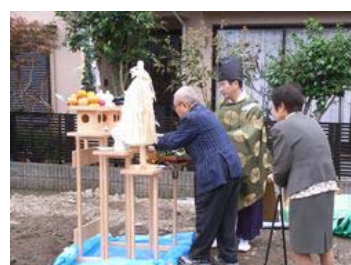
10月中旬上棟予定です。