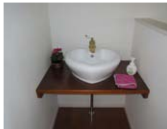
2階ホールのお気に入りの手洗器

Y様邸はJRC所有の貸家を借りていただいておりました。お子様の小学校入学を期に購入いただき、建替えていただきました。メーターモジュール採用のオール電化住宅です。