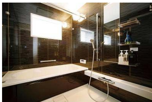
浴室もモノトーンで落ち着いた趣のある趣に...