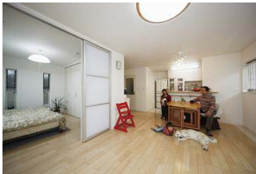
親世帯の明るいリビング