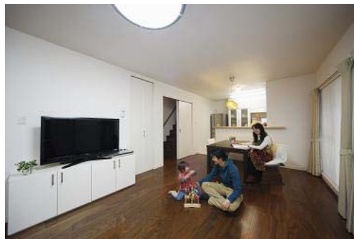
子世帯のくつろぎのリビング