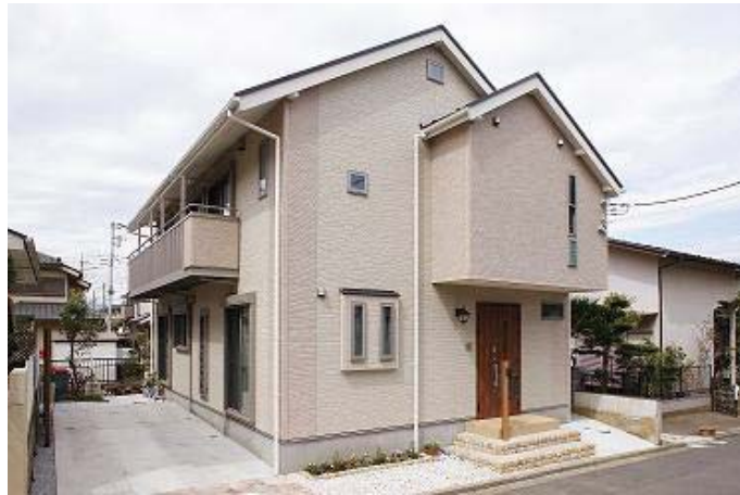
外観のアクセントにこだわった延床面積47坪の建物

実家（奥様の）の近くのアパートに住んでおり、そろそろマイホームと考えていた所、実家を建替える計画も出たので、「それならば一緒に住もう」と意見が一致しました。