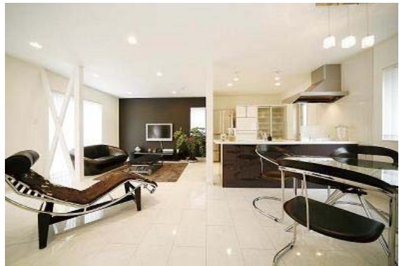
広々としたリビングダイニング

結婚して5年ほど経ち、自分達の家が欲しいと思いました。また、家建てるなら自分達が思い描く家に住みたいと思い、注文住宅が良いと考えました。