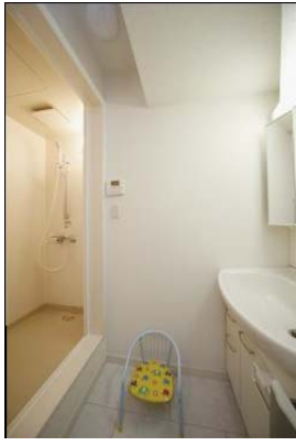
2階子世帯にはシャワースペースを設けました