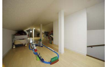
小屋裏収納は子どもの遊び場