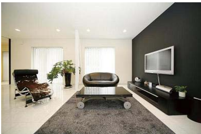
配色のバランスが絶妙なりビングルーム

思い描いたイメージを伝えると営業担当さんが、よく理解してくださりアドバイスをくれたので、苦労は感じませんでした。その分、営業担当さんは大変だったかもしれませんが・・・(笑)