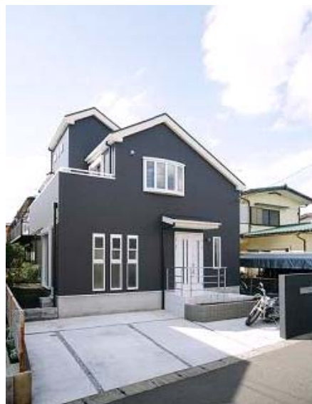
ブラックの外壁にホワイトの玄関とサッシでアクセントをつけました

当初、建築を依頼しようと思っていた建築会社が契約1週間後に倒産してしまいました。頭が真っ白になり、暫くはアクションを起こせずにいました。そんな時に神奈川の注文住宅を見て家造りのセミナーをやっていたり、地域に信頼のある会社だと思い訪問させていただいたところ、親身になって話を聞いてくださり、途中だった家造りを快く引き受けてくださいました。