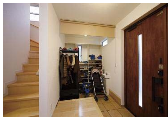
広い収納を確保した玄関