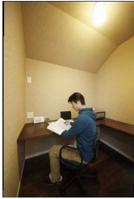
ご主人希望の書斎スペースは特にお気に入りです

私たちは2世帯住宅なので、家族みんなが快適に過ごす為にそれぞれの優先順位を話し合いお互い理解しあうように進めてきたので、優先順位の家族会議は必要だと思います。