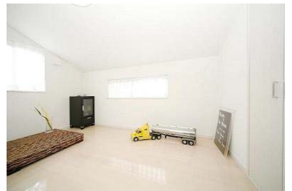
子供部屋はホワイトベースで清潔感たっぷりです