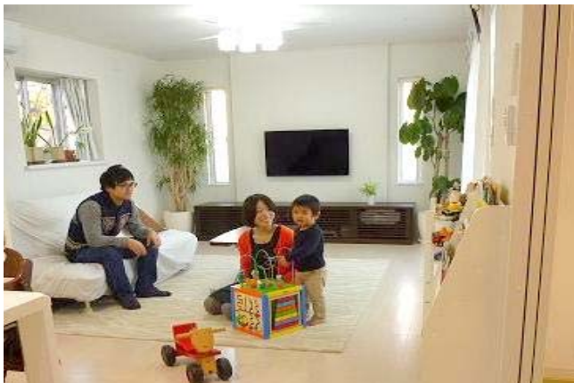
取材の際に、リビングで寛いでいるご家族を撮影しているところを撮影しました。

とても満足しています。家が広くなったので、子供が走り回れて楽しそうです。また、収納が多くなったので、まとめ買いができたり、子供のベビーカーや三輪車を玄関に置けたり、整理整頓できるようになり、気持ちにも余裕が持てるようになりました。キッチンも広くなり料理がしやすく、お風呂は子供と一緒に狭くなくなりました。リビングで家族で過ごす時間が幸せです。