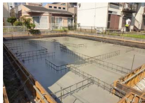
コンクリート打設