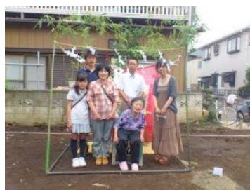
7/6地鎮祭：お施主様ご家族