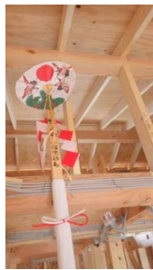
8/3上棟：お施主様ご家族と