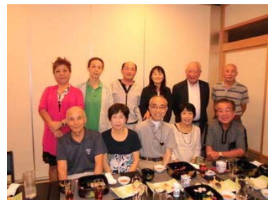
石巻にて親戚一同と