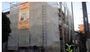
2014年2月お引渡し 2013年11月/着工式 2013年12月/上棟