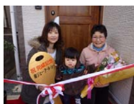
お母様のお部屋には専用のウッドデッキを設置 2013年12月お引渡し