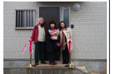
ベランダも広々! 2014年3月お引渡し