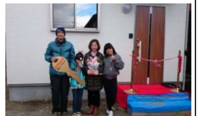
片流れのシンプルな外観 子供部屋/ロフト付 2014年3月お引渡し