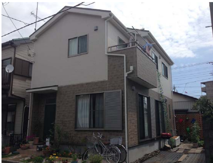
＜快適に過ごしていますとご満足頂いている大和市中央 S棟＞

随分前から建て替えをしないとと思っていたのですが、結婚した子供との2世帯住宅の計画が出たり出なかつたりで、なかなか計画を進めることができずにいました。そんな時にJRCさんのセミナーに参加させていただきました。現場見学会や住宅大学校にも参加して少しずつですが自分が住みたい家について考えました。子供たちとも話をして2世帯住宅の計画を見送ることにしたので、夫婦ふたり、本格的に計画を進める決心をしました。