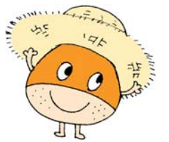
対象年齢：小学校低学年