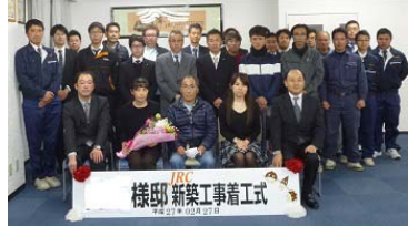
2/27 着工式を行いました。