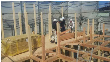
3/27 上棟しました。 6月末竣工予定です。

E様邸を担当させていただいている木村です。 E様には昨年の住宅セミナーにご参加いただき築40数年経過している家をリフォームするか、建て替えをするかご相談をいただきました。 E様は資金計画を始め、ご家族皆様のライフスタイルを考慮して、お建て替えすることを決断されました。 5人家族のE様は6LDKのオール電化住宅です。 ご主人様こだわりの浴室は、なんと2.5帖もあります。 《木村 幸美》