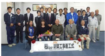
3/26 着工式を行いました。