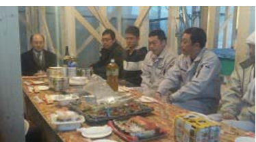
3/23 上棟しました。 6月中旬竣工予定です。