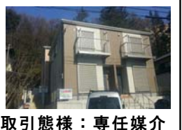
取引態様：専任媒介

◎駐車2台可（車種による） ◎エアコン1台付 ◎Jcom62チャンネル・ネット接続無料 ◆座間市入谷3-2851-10 ◆木造2階建1・2階部分 ◆2015年3月築 ◆契約期間2年（更新可） ◆更新料：新賃料の0.5か月 ◆保険加入要 22,000円/2年