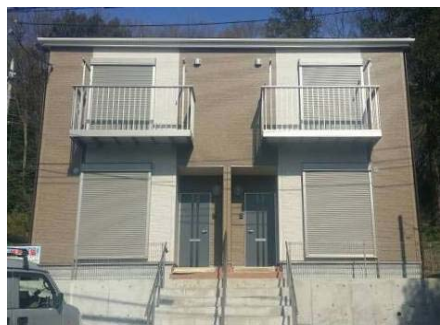
座間市入谷 テラスハウス 利回り12.8%