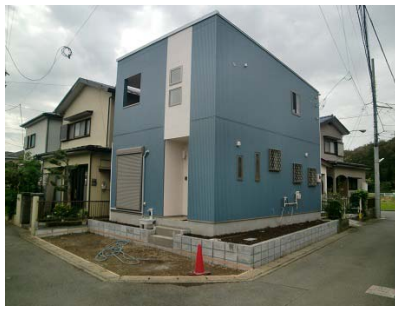
綾瀬市落台北 戸建 利回り12.8%