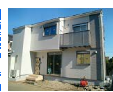
南区橋本 テラスハウス 利回り15.3%