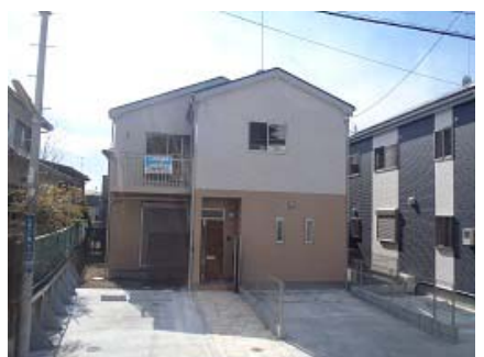
綾沢市辻堂 戸建 利回り14.0%