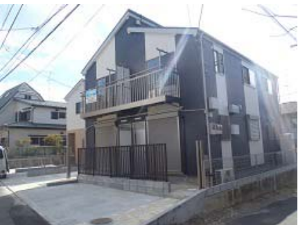
綾沢市辻堂 テラスハウス 利回り18.0%