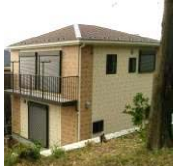
座間市入谷 戸建 利回り12.7%

何といっても南側に広い開口が取れていて日当たりが抜群な所が良かったです。玄関側にもかなりのスペースがあるので、子供と一緒にピニールボールで遊ぶのが今から楽しみです。