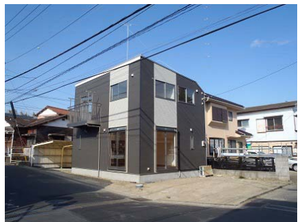
泉区中田南 戸建 利回り10.9%