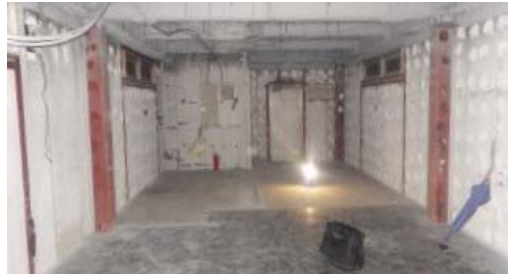
造作前は何も無いスケルトン状態でした。