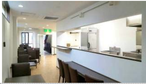
ホワイトとブラウンをベースにした落ち着いた感じのある店内になりました。

カウンターキッチンで、カレー、炭火窯で焼くナンをはじめ世界のビールなども楽しんでいただけます。近くにお越しの際には是非お立ち寄りくださいませ。