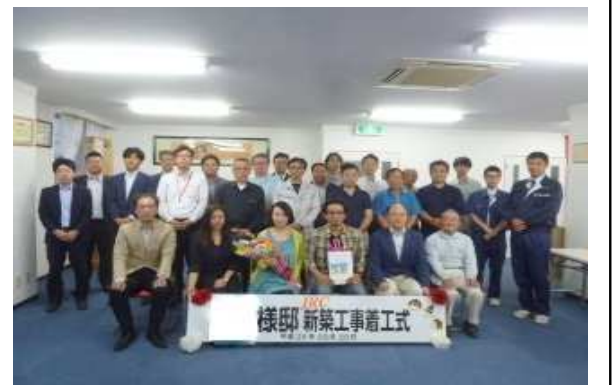
5月20日：着工式にてM様、チームJRC皆様と...