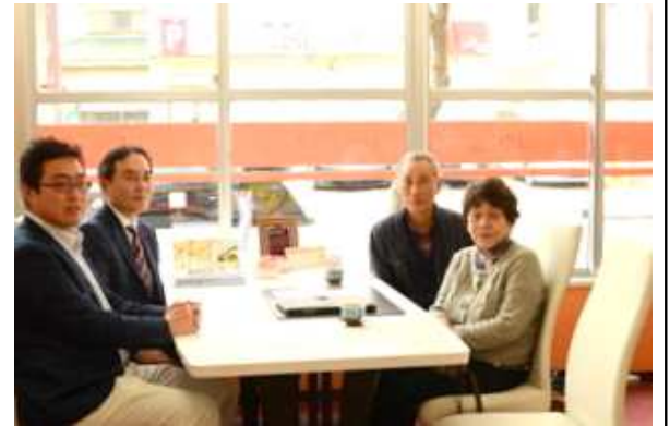
3月26日：契約の時に記念にパチリ!

倒壊する可能性が高いとの評価に、耐震補強工事が建替えかご検討の結果、キッチンやユニットバスも新しく快適に、リフォーム工事では取り付けが難しいホームエレベーターを採用した、建替え工事をご提案させていただき、決断して戴きました。早くも完成が待ち遠しいです。