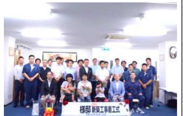
6月25日：着工式にて2人のお姫様とチームJRCと...