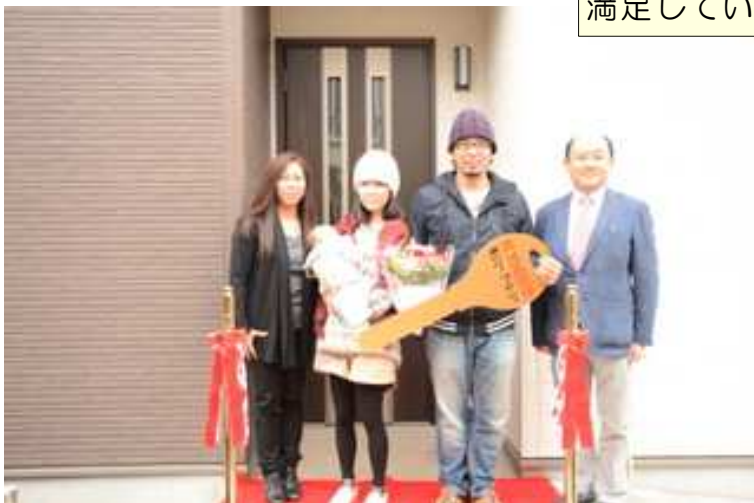
お引渡しにて記念の一枚です。

建て替え前の家と比べて暖かく、朝は外気温が2℃位でも家の中は14~15℃くらいあります。まだ、夏は体験していませんが外気温に影響されず、涼しく過ごせることを期待しています。また、飛行機の音がとてもうるさい地域ですが、現在全く気にならないくらい防音もできていて快適です。各設備も使い易く、満足しています。