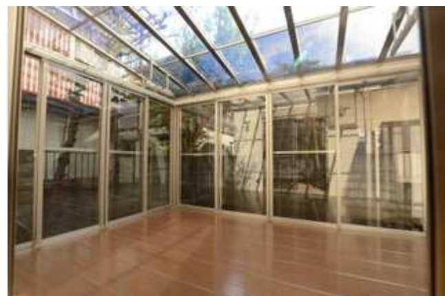
雨や花粉の時期のことを考えてテラスを設けました。また、第2のリビングとしてもご利用いただけます。