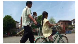
☆公園で自転車練習☆