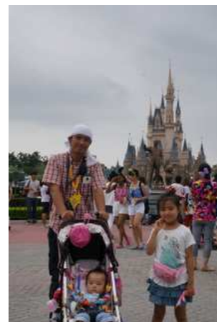
☆ディズニーランド☆

僕が伝えたい事は、マイホームとディズニーランドは似ているという点です。親と手をつないで初めて行った時、学校の卒業旅行で友達で行った時、恋人や嫁とデートで行った時、そして子供と行くディズニーランド。同じ場所でもそれぞれの場面で違う感じ方や素敵な思い出ができます。