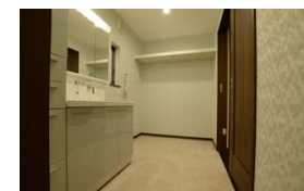
広い洗面室は洗濯物干しスペースもあります