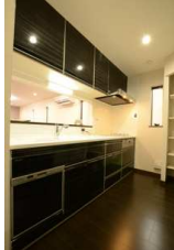
ホーローのハイグレードキッチン