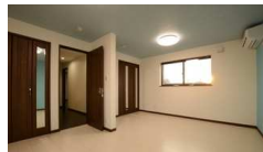
2人のお嬢様の部屋はつながっています

妻の実家のすぐ近くに土地が売りに出たことが、初めの一歩となりました。 南道路で日当たりもよく前面の道路も6mと広い開放感があり、何といても駅まで徒歩7分と近かったので即決しました。