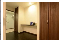
キッチン横には子供の勉強スペース