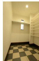
広いシューズクロークは魅力です