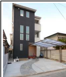
ブラックを基調とした外観