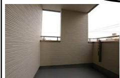
雨の日も安心な屋根付バルコニー

金額は高くなることは分かっていましたが、補助金がある事、エアコンや給湯器などの電力消費が少なく済む事、そしてソーラーパネルで売電することによってお金が戻ってくる事を総合的に考えると、我が家も得するし、環境配慮にも貢献できるので決めました。