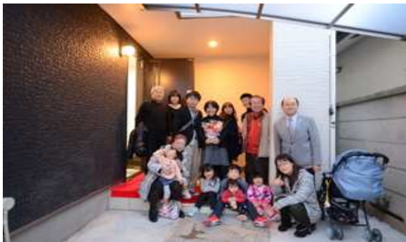
ご親族皆様で引き渡し式