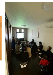
引渡し事に完成までのDVD上映