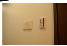
自動で施錠できるシステム