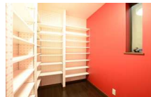
奥様の書斎はハート柄☆