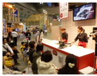
IHクッキングヒーターの実演の様子です。この後に実際に使い勝手を体験できる体験コーナーが開催されました