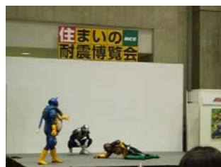
仮面ライダーショーも...子供のみならず、大人も夢中になっていて観覧席は満席。握手会では子供達が大興奮でした