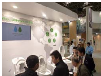
トイレの便器だけでも7~8台が横1列に展示されており、より節水出来るタイプが新商品として展示されていました