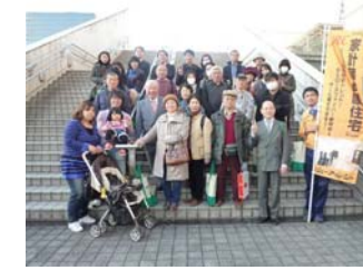
ご参加頂いた皆様と弊社スタッフにて記念写真の撮影を行いました(ビックサイトにて)