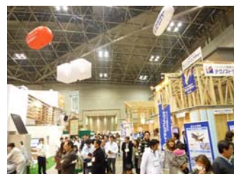
3ホールを使用した広大な会場では実物大の家の構造体が組まれていてたくさんの方が見入っていました

次回は8月頃を予定しております。7月にはお手紙にてご案内致しますので、次回はぜひ皆様も参加なさってみてはいかがでしょうか。