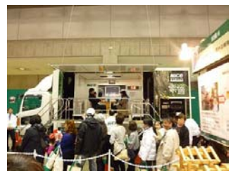
地震体験車は1番人気のブースで、長い列が出来ていました。揺れを体験して、免震・制震も学べます