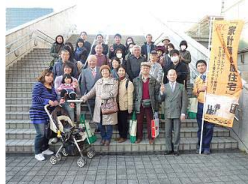
前回の見学会にて…

業者等のご案内がないと入場できない貴重な展示会ですので、この機会にぜひご参加下さい！