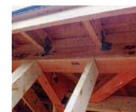
屋根組みをご覧ください