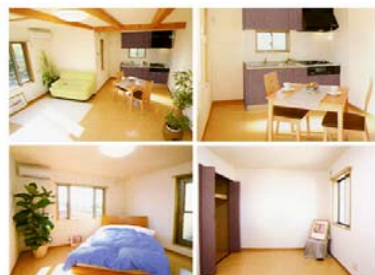
『戸建賃貸住宅』内装一例

今回ご覧いただく『戸建賃貸住宅』は、間取りが2LDK、20坪のコンパクトな建物です。間口が狭い敷地にも対応できるプランになっています。外観は横浜市の1種高度の制限のため屋根形状は切妻に変更しております。