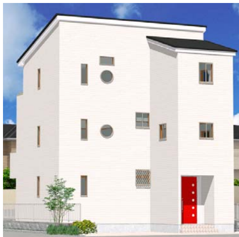
ホワイトの外観とレッドの玄関ドアや丸窓がアクセントのご邸宅です。