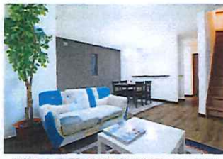
※当社施工の同規模(設備仕様)写真となります