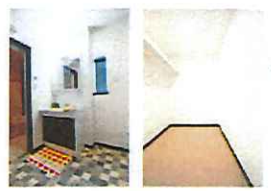
※当社施工の同規模(設備仕様)写真となります