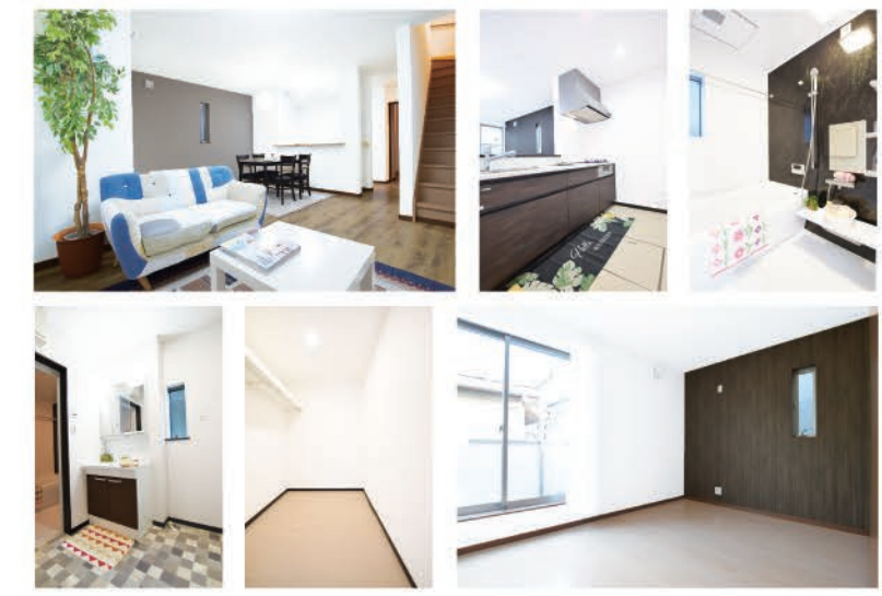
※当社施工の同規模(設備仕様)写真となります

■所在地/神奈川県綾瀬市吉岡東5丁目9-21 ■交通/小田急江ノ島線「高座渋谷」駅徒歩60分・車14分 ■引渡し/令和5年11月末(完成予定) ■構造/木造アスファルトシングル葺2階建 ■土地面積/86.97㎡ ■建物面積/86.12㎡+小屋裏収納21.11㎡ ■間取/3LDK ■土地権利/所有権 ■都市計画/市街化区域 ■地目/宅地 ■現況/建築中 ■用途地域/第一種住居地域 ■建ぺい率/60% ■容積率/184% ■防火指定/準防火地域 ■都市計画/市街化区域 ■設備/本下水・公営水道・東京電力 ■幅員/4.62m ■接面/約4.49m ■建築確認番号/第23UD11K建00264号